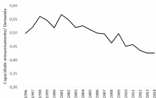
Figura 2 – Relação entre a capacidade de armazenamento do SIN e a demanda, 1996-2014 (ONS, 2016 e EPE, 2014)

Historicamente, os reservatórios foram utilizados para atender a demanda durante o período seco do ano, minimizando o uso de fontes térmicas no sistema. Porém, na medida em que a demanda aumente e a oferta adicional de energia seja basicamente de fontes não controláveis, os reservatórios cada vez terão menor capacidade de regularizar o sistema. Neste sentido, a Figura 2 mostra que a relação entre a capacidade máxima de armazenamento dos reservatórios e a demanda de energia vem se reduzindo nos últimos anos.